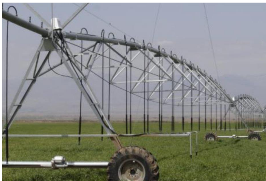
طراحی و ساخت آبیاری بارانی محوری (سنتر پیوت) (سال 1372)