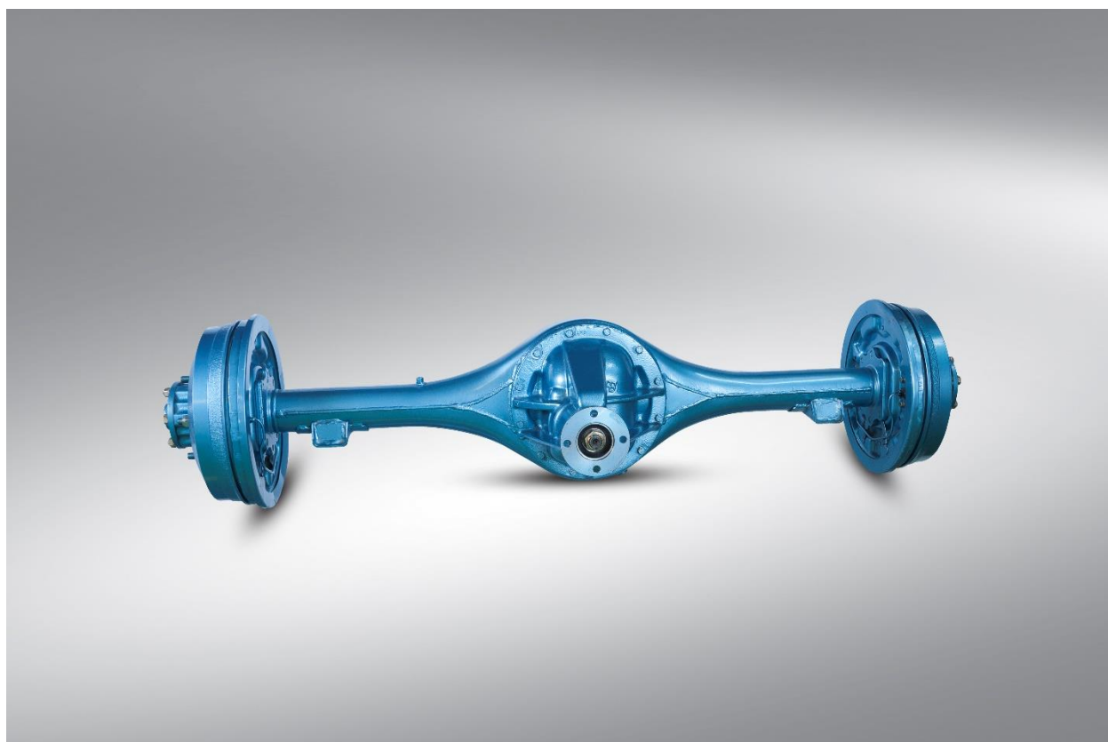
اکسل عقب پیک آپ مزدا

سپس آذراتصال شروع به تولید اکسل نمود و در این زمینه صاحب تخصص و فناوری گردید و طی چندین دهه تجربه و نوآوری در تولید اکسل، اکنون شرکت آذراتصال در بین تولیدکنندگان پیشرو در صنعت خودروسازی ایران قرار دارد.