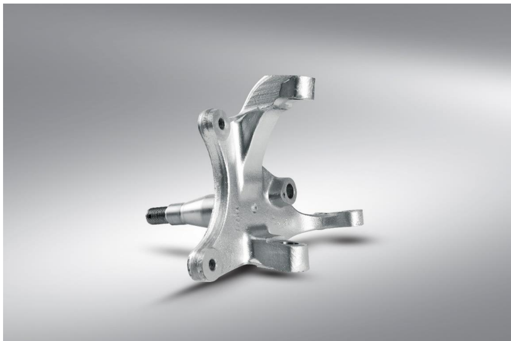
قطعه سگدست پیک آپ نیسان

به عنوان مثال، بخش تحقیق و توسعه ما برای نشان دادن توانایی‌های خود، یک اکسل محرک آفرود طراحی و تولید کرد.