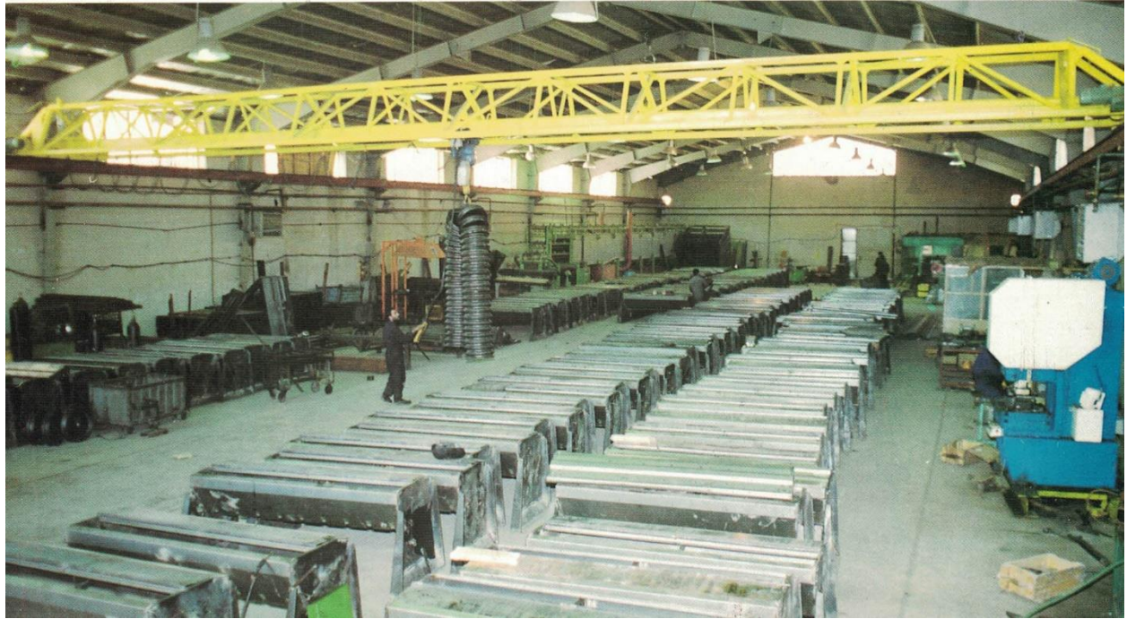
کارگاه ساخت قطعات عمیق کار و کمپینات