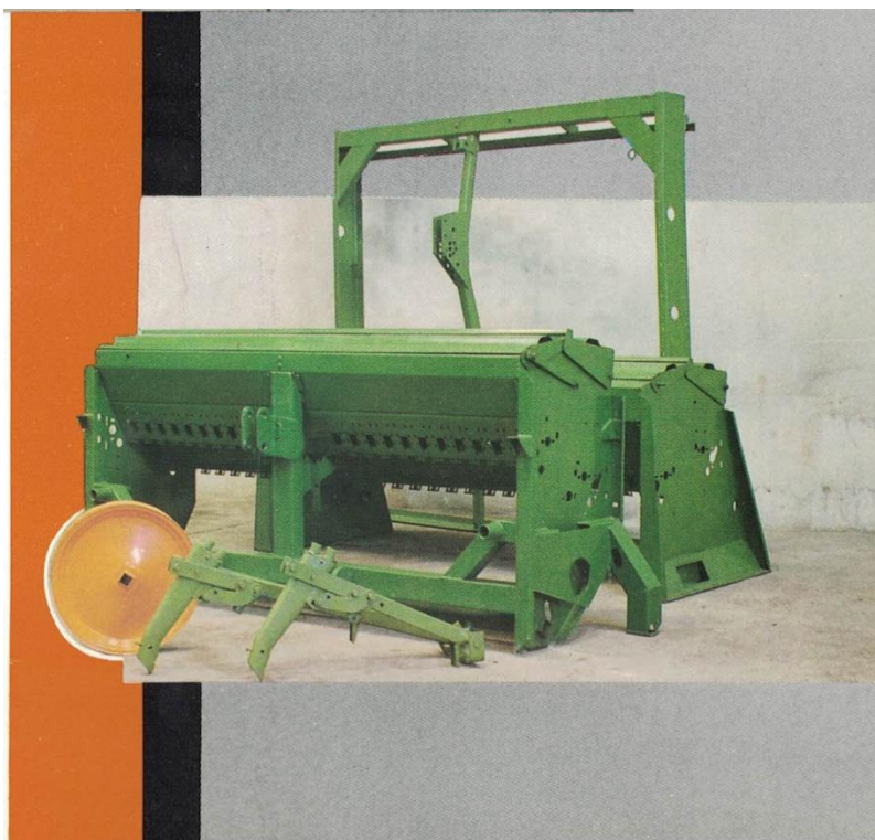
قطعات عمیق کار-کودر کار-بذر کار (سال 1371)