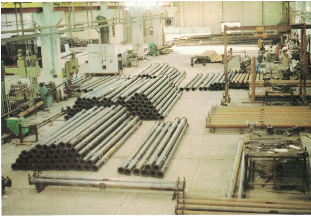
کارگاه ساخت قطعات سنترپیووت