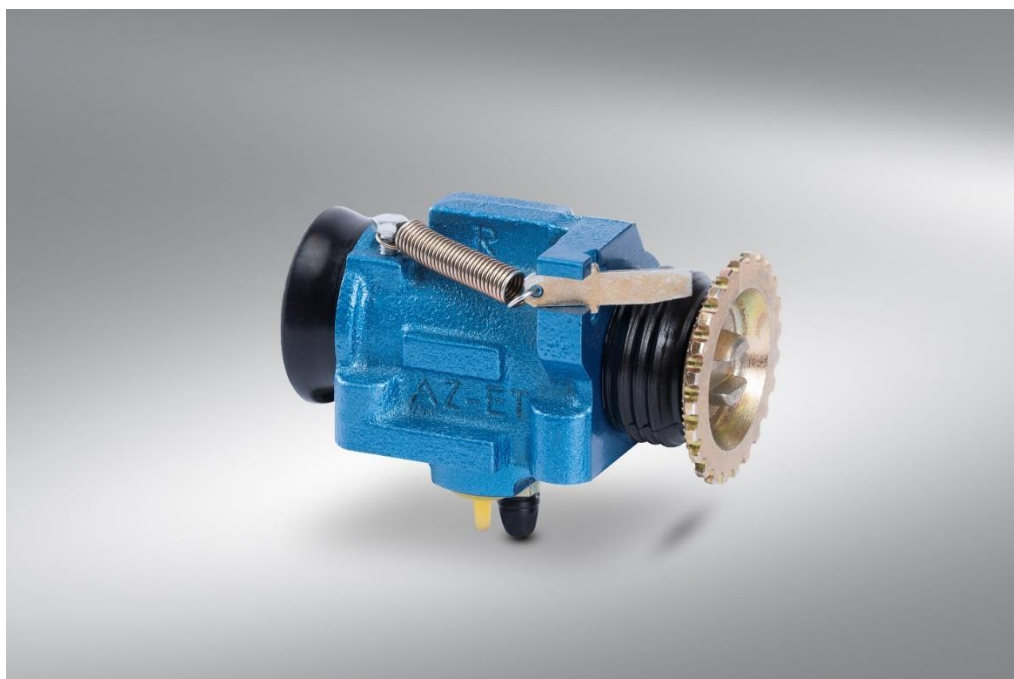
سیلندر ترمز خود رگلاژ پیک آپ نیسان

به عنوان مثال شرکت ما سیلندر ترمز خود تنظیم را برای پیک آپ نیسان جونپور طراحی و تولید کرده و اکنون سالیان سال است که بر روی این خودر مونتاژ می شود.