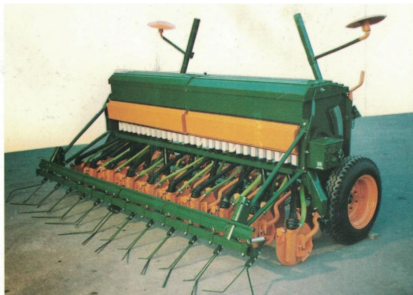
طراحی و ساخت کمبینات سال (سال 1370) DF 250-DF 300

شرکت آذراتصال در سال 1363 تاسیس شد. آذراتصال فعالیت خود را با تولید قطعات ماشین آلات کشاورزی و صنعتی آغاز کرد. این شرکت با ایجاد مراکز تخصصی فنی توانسته در طراحی و ساخت اکثر قسمت های ماشین آلات کشاورزی گام های موثری بردارد و با توجه به این مساله که تمام قالب ها و فیکسچرهای مربوطه در داخل شرکت طراحی و ساخته می شود، لذا این امکان را به ما می دهد که اجرای پروژه های صنعتی با کیفیت برتر و در حداقل زمان به ثمر برسد.