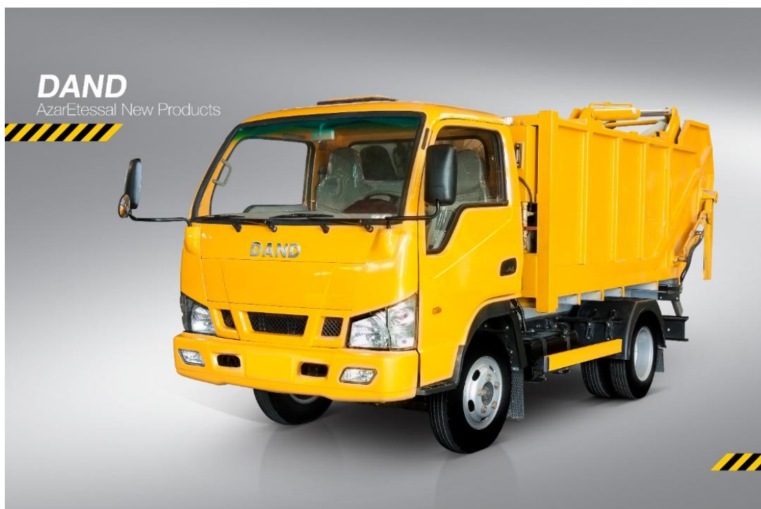
کامیونت دند با کاربری حمل زباله